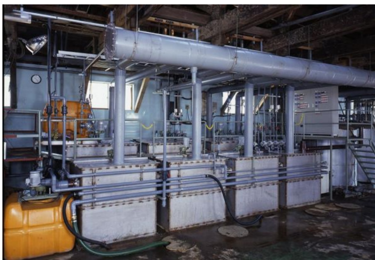
(無電解ニッケルメッキ廃液処理装置)