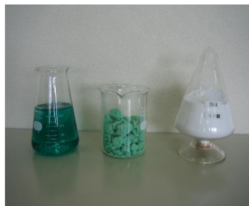
(上図)左から順に、無電解ニッケルメッキ廃液脱水固化したニッケル化合物、粉末状に加工したリン