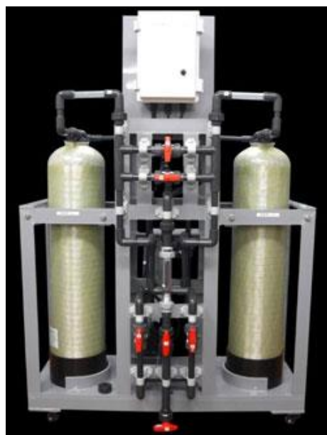
パラジウム回収装置